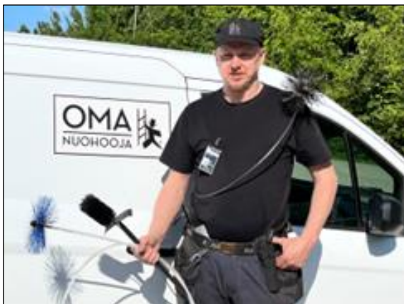
Kesällä tehty nuohous vähentää pakkaskauden ruuhkia.

Nuohouksen voit tilata jäsenetuliikkeeltämme Nuohoojapojat sähköisellä ajanvarauslomakkeella https://nuohoojapojat.fi/ajanvaraus.html tai puhelimitse 045 612 2774.